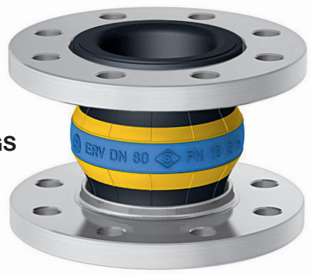
Type ERV-GS HNBR

Innen : HNBR (Nitril), nahtlos, hoch abriebfest Druckträger : Verzinkter Stahldrahtcord Außen : Chloropren CR Kennzeichnung : Gelb-blau-gelbe Ringe, ERV DN .., PN .., Herstelldatum Flansche 1) : Drehbar, DIN PN 10/16, Stahl, verzinkt